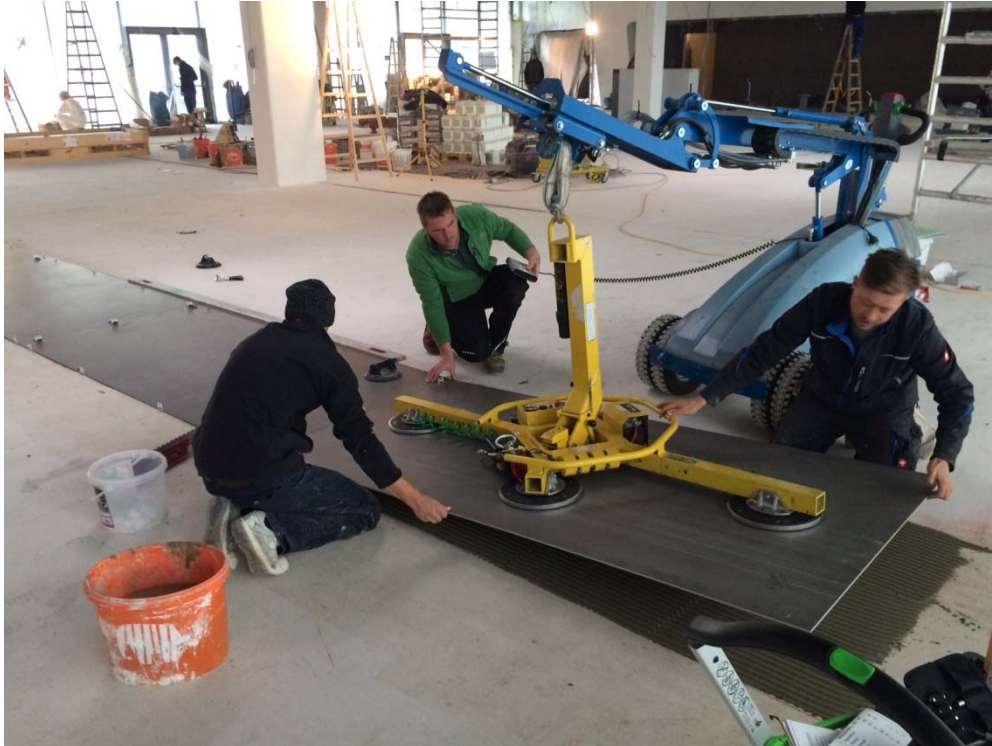
Bild 5: Präzisionsarbeit: Die Großformate wurden exakt eingepasst. Ist eine Korrektur notwendig, lässt sich diese mittels Maschinenteknik einfacher durchführen.