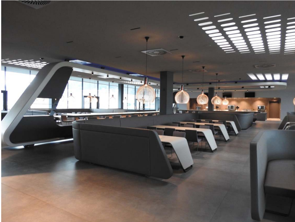
Bild 1: Die F. LIST GMBH in Thomasberg baut exklusive Interieurs für Privatjets, Yachten und Villen. Auch bei der Innenausstattung seines neu errichteten Betriebsrestaurants legte Aufsichtsratsvorsitzender Franz List großen Wert auf Design und hochwertige Ausführung.