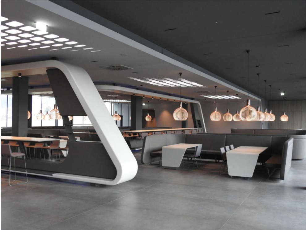
Bild 2: Für den Boden wählte der Bauherr großformatiges Feinsteinzeug und beauftragte die Fliesenlegerfachabteilung Keramik Bau Weiz (Lieb Bau Weiz GmbH & Co KG), die seit vielen Jahren mit PCI-Produkten arbeitet. Der Untergrund wurde zunächst mit PCI Gisogrund 404 vorbereitet.