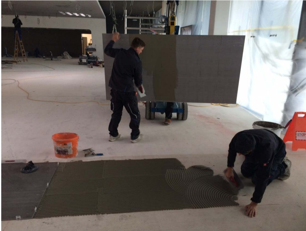
Bild 3: Die Handwerker verlegten die 240 x 120 Zentimeter großen Platten im Buttering-Floating-Verfahren mit dem Mittelbettmörtel PCI Carrament grau, vergütet mit PCI Lastoflex speziell für die Verlegung von Feinsteinzeug.